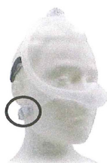
Figure 2 : Masque nasal DreamWisp