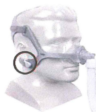
Figure 4 : Masque nasal Wisp et masque nasal Wisp Youth