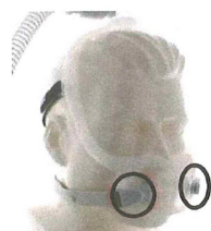
Figure 3 : Masque naso-buccal DreamWear