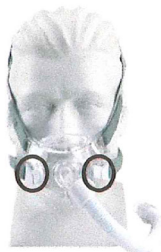
Figure 1 : Masque naso-buccal Amara View

Les images des masques concernés sont présentées ci-dessous. Les clips magnétiques pour harnais sur ces masques sont encerclés. Ces images peuvent être utilisées comme référence pour déterminer si votre masque ou celui de votre patient utilise également des clips magnétiques pour harnais. Ces masques sont destinés à fournir une interface pour l'application de la thérapie CPAP ou bi-niveau aux patients. Les numéros de pièces des masques et des composants de masque concernés qui contiennent des aimants sont indiqués dans la figure 6.